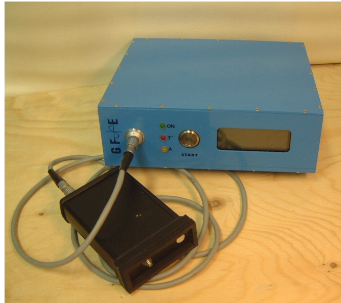
Abbildung 1 Sonalis mit Meßkopf (vorne)